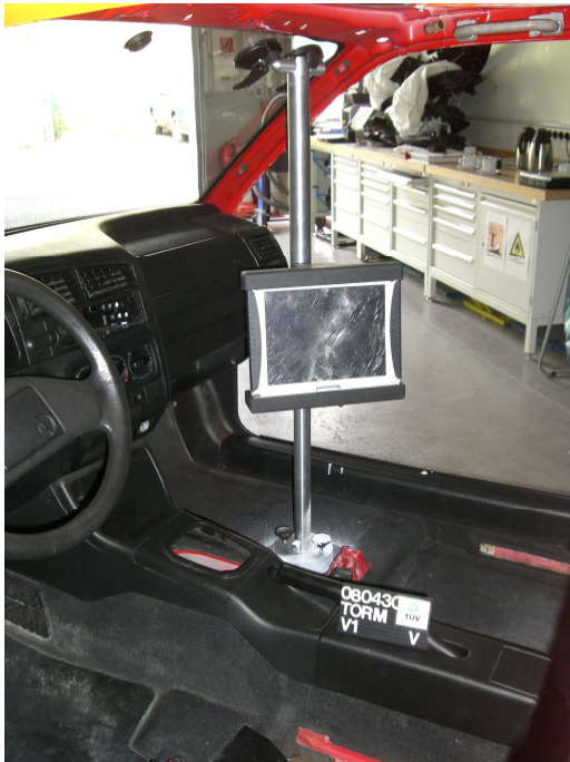
Foto nach Airbagversuch